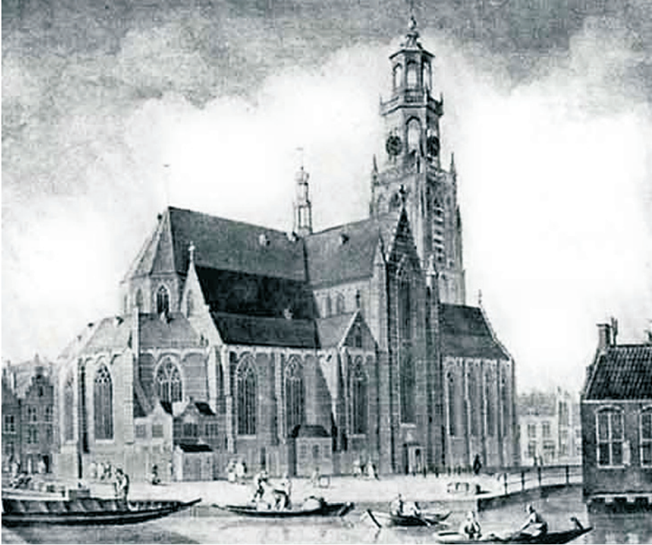
Rotterdam, de Grote Kerk