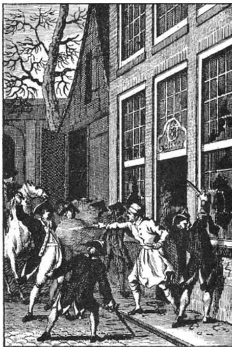
Beweging te Arnhem, 1795