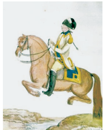
Cavalerie Orange Friesland