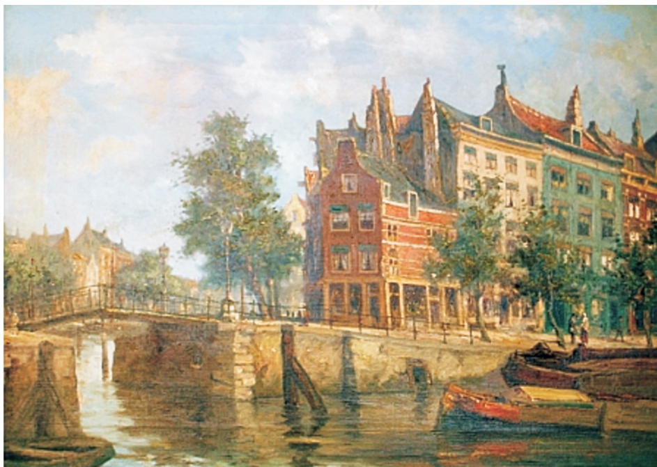
Rotterdam, de Spaanse kade