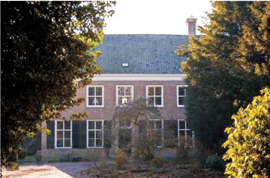
Breda, buitenplaats Zoudtland

De buitenplaats is ontstaan uit een boerenhoeve waarnaast later een herenhuis werd gebouwd. De naam dankt de buitenplaats vermoedelijk aan Jhr Peter van Soutelant, schout van Turnhout