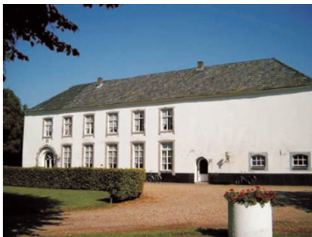
De stift Keyzersbosch