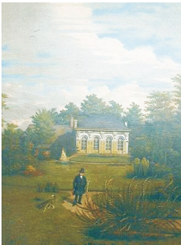
Landgoed 'de Denneboom' bij Schijndel, met links achter de oude hoeve en rechts het nieuwe huis uit 1854