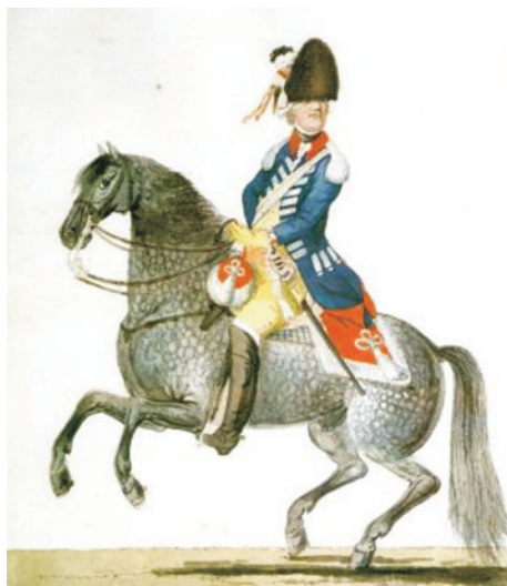
Cavalerie Gardes Dragons