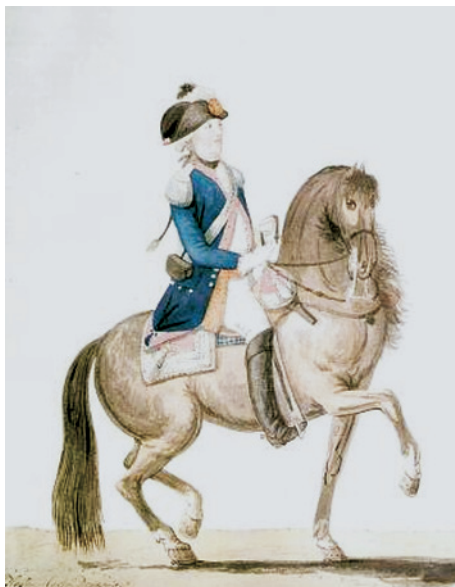
Cavalerie Hessen-Cassel Dragons