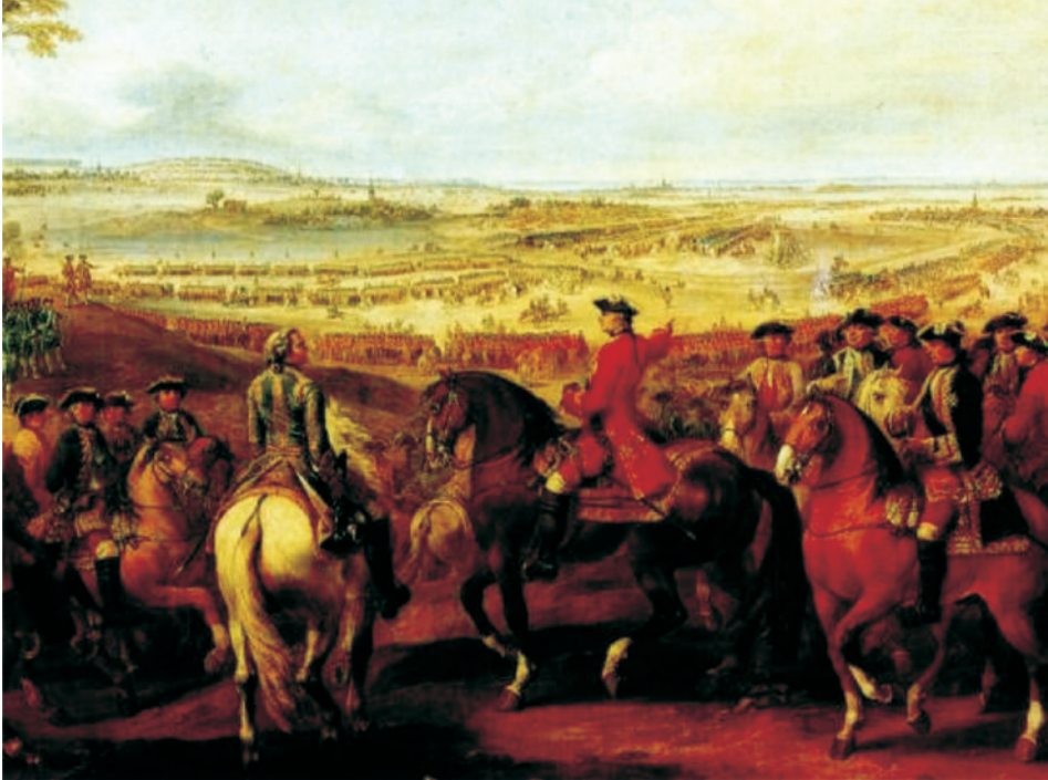
Slag van Lafelt, 2 juli 1747