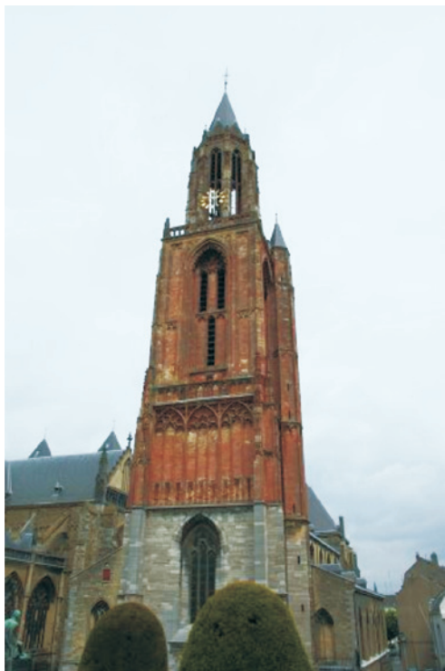
Maastricht, St. Jan